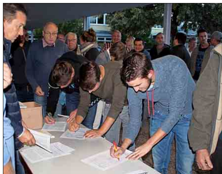
„Nein zu den künstlichen Flutungen“: Unterschriftenlisten der BI.